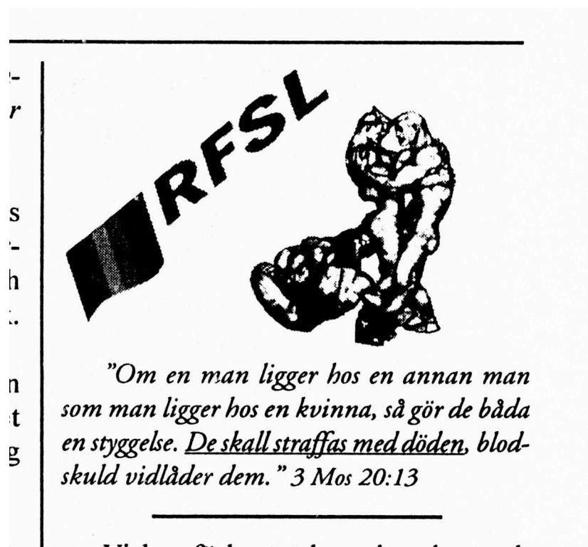
Flygblad från Kristna Nationskyrkan

Homosexualitet klassades som en sjukdom i Sverige fram till 1979. Att homosexualitet skulle vara en psykisk sjukdom eller genisk defekt är dock en föreställning som lever kvar bland nazistiska och rasistiska grupper. Genom att beskriva hbt-personer som sjukliga eller defekta gör man gruppen till bärare av ett lägre människovärde, precis som nazister i 30-talets Tyskland rangordnade människor beroende av ras, funktionshinder, politisk åsikt eller sexuell läggning. Ett lägre människovärde gör det i sin tur lättare för nazister och rasister att rättfärdiga våld, misshandel, trakasserier och hat mot hbt-personer. Vidare vilar nazistisk och rasistisk homofobisk ideologi på idén om att hbt-personer åtnjuter en särskilt privilegium vad gäller inflytande hos staten och massmedian. Man kan dra uppenbara paralleller till hur nazister traditionellt beskriver judar och hur man beskriver hbt-personer.