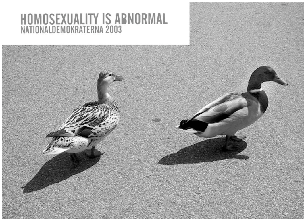
Propagandabild från ND

Idén om den vita rasens övermakt är grunden i nazistisk och rasistisk ideologi. Idag undviker dock många grupper att använda explicit rasideologi. Budskapet ramas in i termer av ”svenskar”, en grupp som ska förstås som de vita invånare i Sverige vars släktband är knutna till den geografiska platsen Sverige (eller åtminstone Norden). Till denna grupp kopplas också ett specifikt, nationalromantiskt kulturarv som innefattar bland annat normen om den heterosexuella kärnfamiljen. Kärnfamiljen beskrivs som själva grunden gruppen svenskar står på och som en bas i nazistisk och rasistisk kamp. Män och kvinnor ges i propagandan mycket traditionella könsroller som bygger på en kvinnlig underordning.