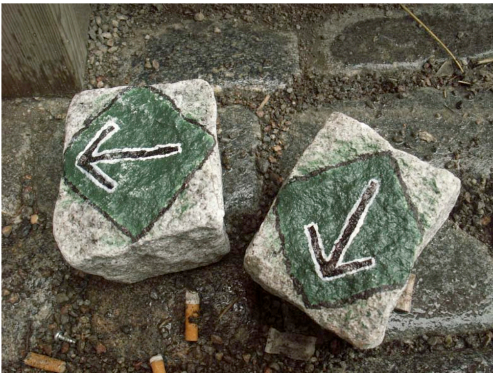
Gatstenar märkta med Svenska Motståndsrörelsens symbol Odalrunan, använda vid attentat

med i termer av ett krig. Propagandan och ideologin har också funktionen av att hålla samman och organisera nazister och rasister och idag utgör den homofobiska propagandan en stor andel av ideologin. Det förakt för demokratin som samlar de nazistiska och rasistiska rörelserna, tillsammans med den starka homofobin, lägger grunden till grova hatbrott, såsom misshandel och mordbrand. Under de senare åren har vi sett en ökning av hatbrotten, både mot individer och i form av skadegörelse och trakasserier mot hbt-relaterade föreningar och klubbar. RFSL är särskilt utsatt. Syftet med hatbrotten är både att skada och skrämja hbt-personer, men också att genom handling sluta de nazistiska och rasistiska leden. För de nazistiska och rasistiska grupperna handlar det som sagt om ett krig.